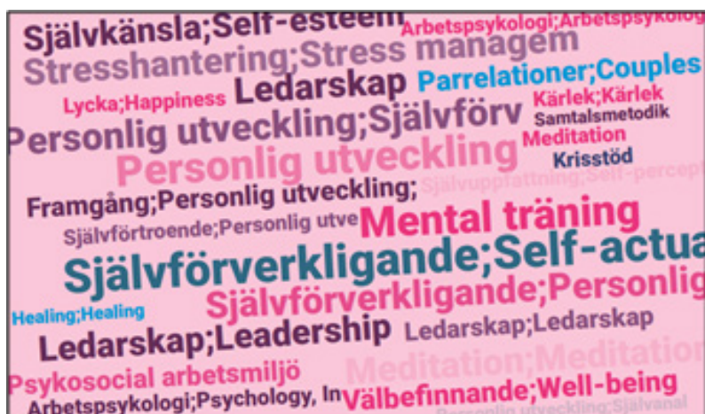
Рис. 1. Приклад візуалізації даних національної бібліографії Швеції у вигляді хмари тегів (Kungliga biblioteket, 2019, p. 17)

Із хмари тегів видно, що найпопулярнішими ключовими словами з обраного потоку видань у 1985–2015 роках були «особистісний розвиток», «самореалізація», «самосприйняття», «управління стресом», «медитація», «ментальне навчання», «лідерство», «психосоціальне робоче середовище» (рис. 1). Причому відзначається, що якщо у 1980–1990-х роках зміст літератури за досліджуваною темою описувався такими ключовими словами, як «боротьба», «перемога», «сміливість», «опір», «свобода», то у 2000-х акцент змістився у бік «трансцендентності», «містицизму», «споглядальності». Візуалізація також показала тенденцію до розвитку критичного ставлення до літератури із самодопомоги.