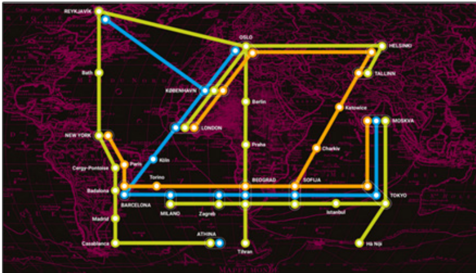
Рис. 4. Приклад візуалізації даних національної бібліографії Швеції у вигляді картограми (Kungliga biblioteket, 2022)

Шведські детективи сьогодні дуже популярні у всьому світі. Картограма у вигляді схеми метро на прикладі трьох популярних творів – «Крижана принцеса» Камілли Лекберг, «Пісочний чоловік» Ларса Кеплера, «1793» Нікласа Натт-о-Даґа – охоплює міста у різних країнах, де видані їх переклади. Так, наприклад, у Копенгагені, Лондоні і Токіо видані переклади усіх трьох детективів (рис. 4).