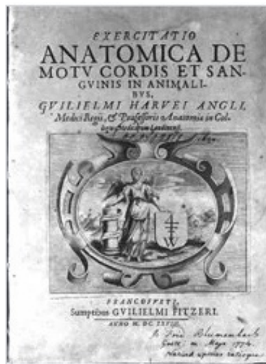
Рис. 1. Титульний аркуш «De Motu Cordis» Вільяма Гарвея (1628). Із бібліотеки Хаскелла Ф. Нормана (Norman, 1982).

Відтак, книга як суб'єкт спілкування і оповідач здатна «розповісти» не лише викладений у ній текст, а й історію свого творця або власника.