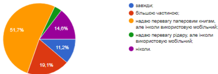
Рис. 3. Результати відповідей студентів на питання «Чи читаєте Ви книжки за допомогою мобільних гаджетів?».

Подібні результати були отримані також під час опитування студентів у США, відповідно до яких і при навчанні, і на відпочинку студенти віддають перевагу читанню саме паперових книжок. Із 80 учасників анонімного опитування, проведеного 2015 р. серед студентів California Polytechnic State University (Політехніч-